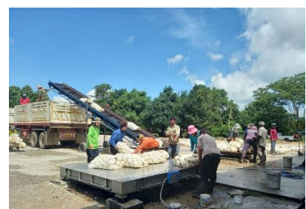
ติดตามการใช้เงินกู้ให้เป็นไปตามวัตถุประสงค์การกู้เงินกองทุนพัฒนาสหกรณ์