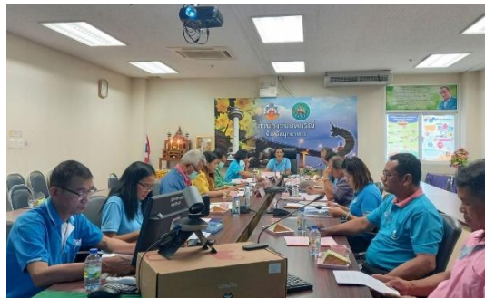
ประชุมคณะกรรมการพิจารณาเงินกู้กองทุนพัฒนาสหกรณ์ จังหวัดมุกดาหาร