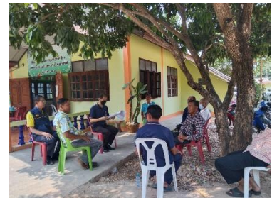
จัดทำสัญญาเงินกู้กองทุนพัฒนาสหกรณ์ แนะนำวัตถุประสงค์ในการกู้เงินและเงื่อนไขสัญญาเงินกู้ พร้อมทั้งกำกับให้สหกรณ์นำเงินไปใช้ให้เป็นไปตามวัตถุประสงค์และชำระหนี้คืนกองทุนพัฒนาสหกรณ์ตามระยะเวลาสัญญา